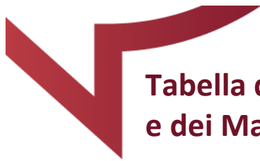
Tabella delle Prestazioni e dei Massimali