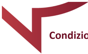
TABELLA DELLE PRESTAZIONI E DEI MASSIMALI

L'Assicuratore, a seconda della forma di copertura assicurativa attivata dal Contraente e richiamata sul certificato di polizza, terrà a proprio carico i costi delle Prestazioni erogate alle condizioni e con i limiti indicati nella sezione "Cosa è assicurato", entro il Massimale indicato nella seguente tabella: